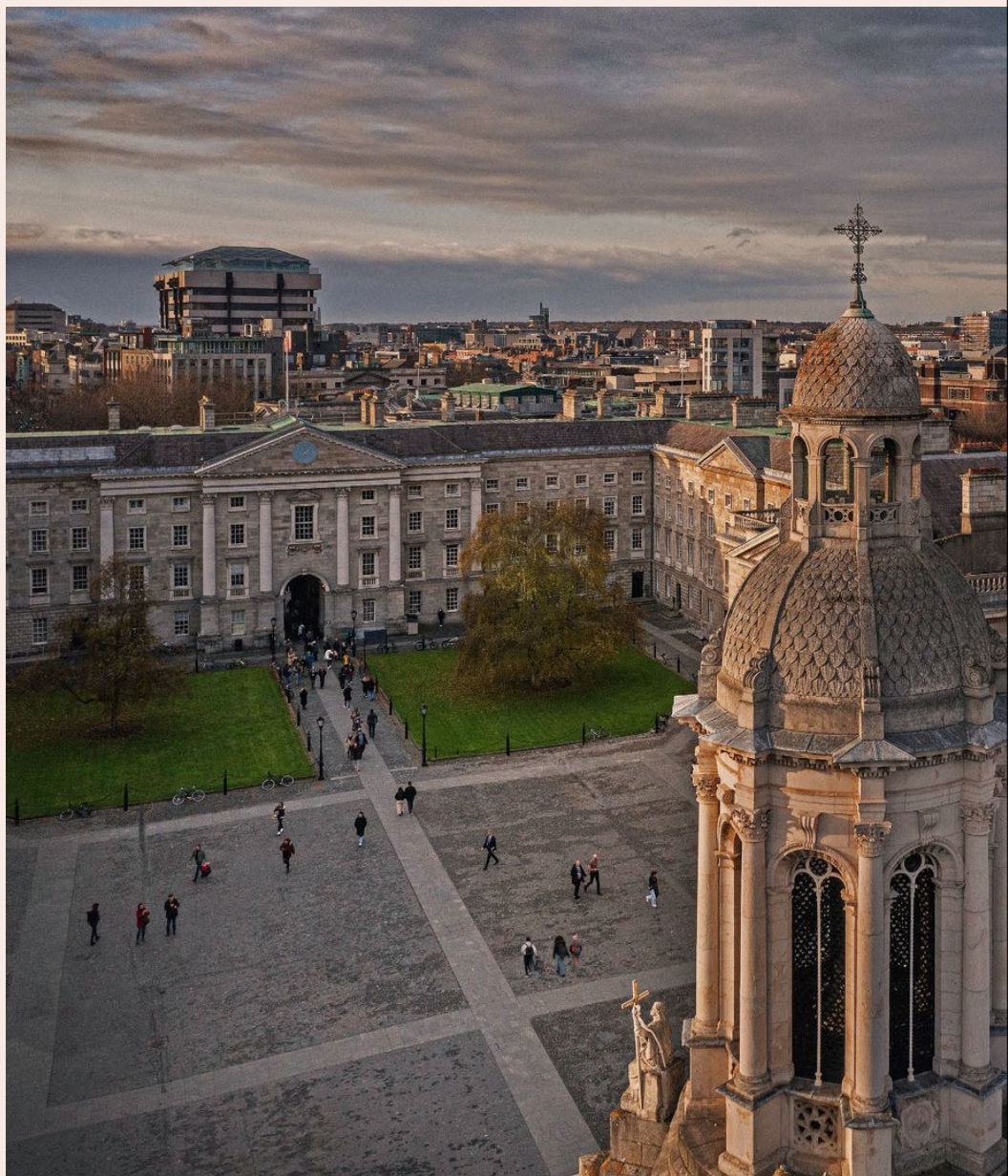
EN EGEN VÄRLD. Torget Front square är det första som möter en besökare som kommer in genom porten till Trinity College i Dublin. Klocktornet i mitten är från 1853 och sträcker sig högt över de andra