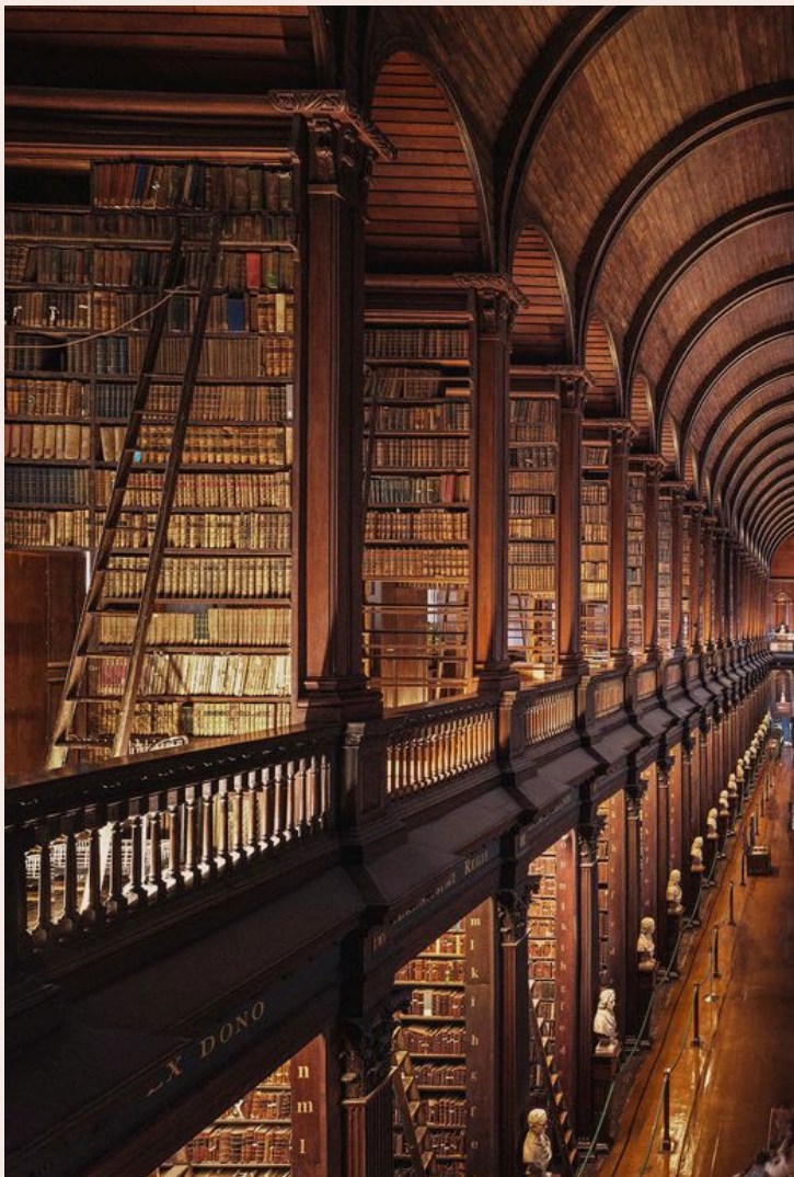
STÄMMINGSFULLT. Det kända biblioteket stod klart 1732. I höst stängs det för en omfattande renovering som kommer att ta flera år. Salen har använts i otaliga filmer och inspirerat både regissörer och andra med sin speciella miljö. Förutom otaliga förstaupplagor av klassiska böcker finns marmorbyster av kända tänkare i det gamla biblioteket.

Ibland skymtas en av de gulblå stadsbussarna bortom områdets höga staket, en påminnelse om att man trots den lugna atmosfären inte lämnat stan. □