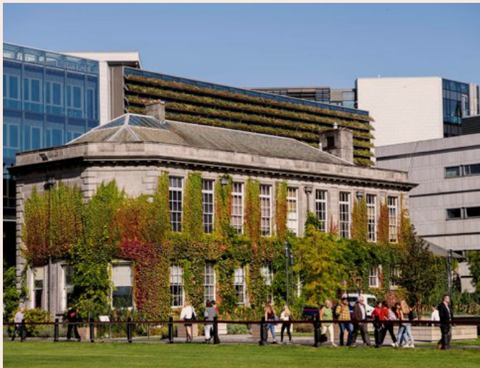
POPULÄRT. Universitetsområdet tar emot ungefär två miljoner besökare varje år. Det centrala läget i Dublin underlättar för turister.