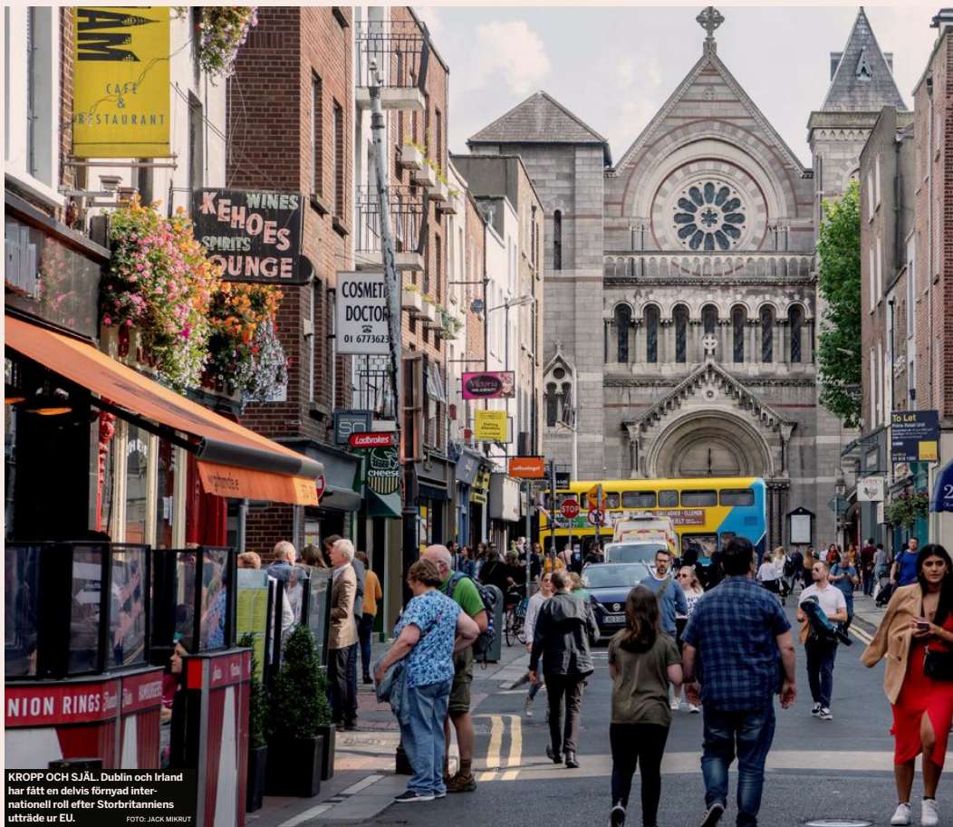
KROPP OCH SJÄL. Dublin och Irland har fått en delvis förnyad internationell roll efter Storbritanniens utträde ur EU.