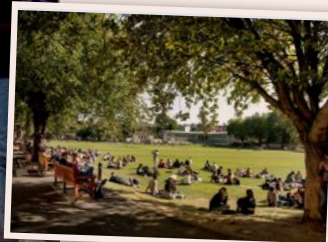
Den gröna ön.