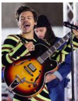
Den brittiske artisten lög igenom i pojkbandet One Direction 2010.

Harry Styles representerar en ny typ av pop-och rock-stjärna. En som skriver låtar om att bemöta människor med vänlighet, en som hyllar kvinnor utan att det känns som en pr-strategi, och en som vägar utmana traditionella mansnormer öppet och